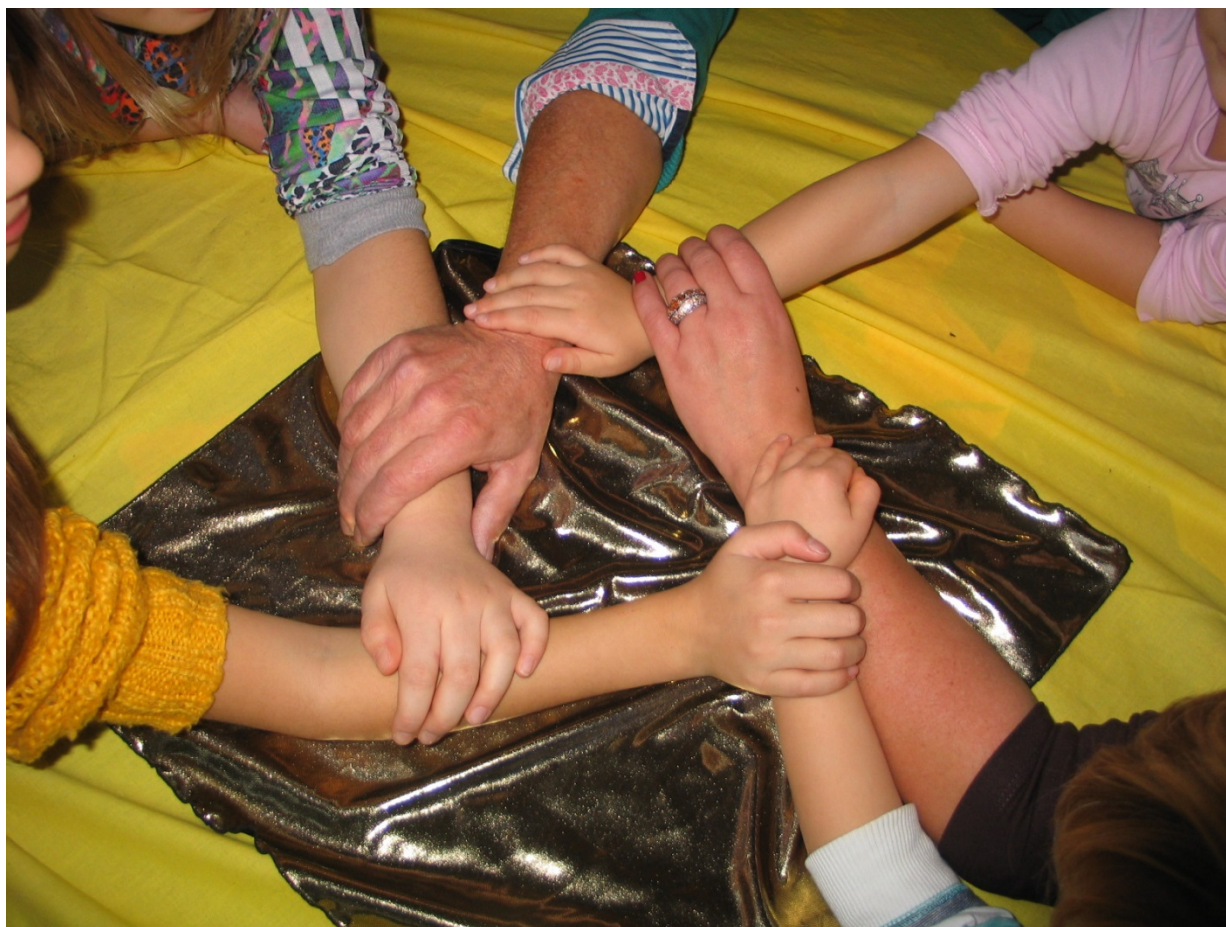
Foto: Kinder, Lehrkräfte und Eltern unserer Schule Hand in Hand

Kinder, Lehrkräfte und Eltern wünschen sich oft eine Schule zum Wohlfühlen! ...