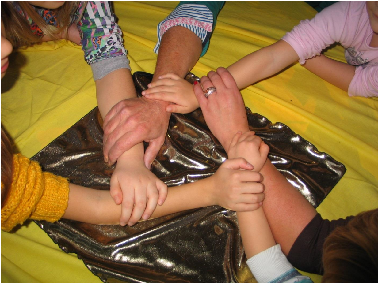
Foto: Kinder, Lehrkräfte und Eltern unserer Schule Hand in Hand